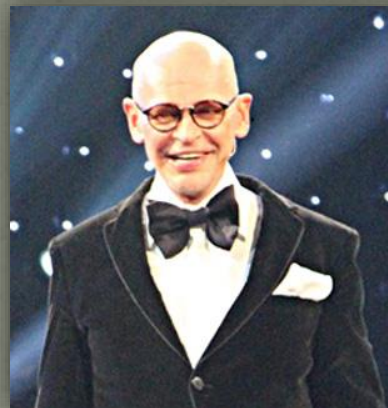
Kunniaseniori Jorma Uotinen

Porin Suomalaisen Yhteislyseon Seniorit ry:n kutsumana esiintyy koulun entinen oppilas Kansallisbaletin johtaja JORMA UOTINEN perjantaina 27. 2. 1998 klo 18 koululla, Tasavallankatu 4. Teemana on "Minun teatterini". Tilaisuuteen on kaikella kansalla vapaa pääsy.