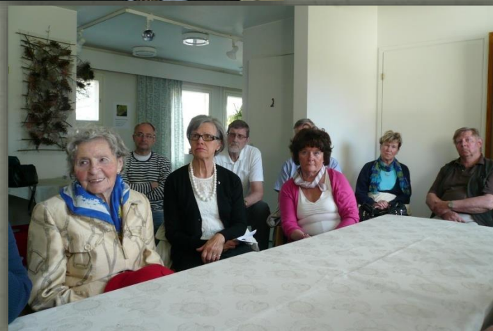
Kokousväkeä Vihertietokeskuksessa 2013