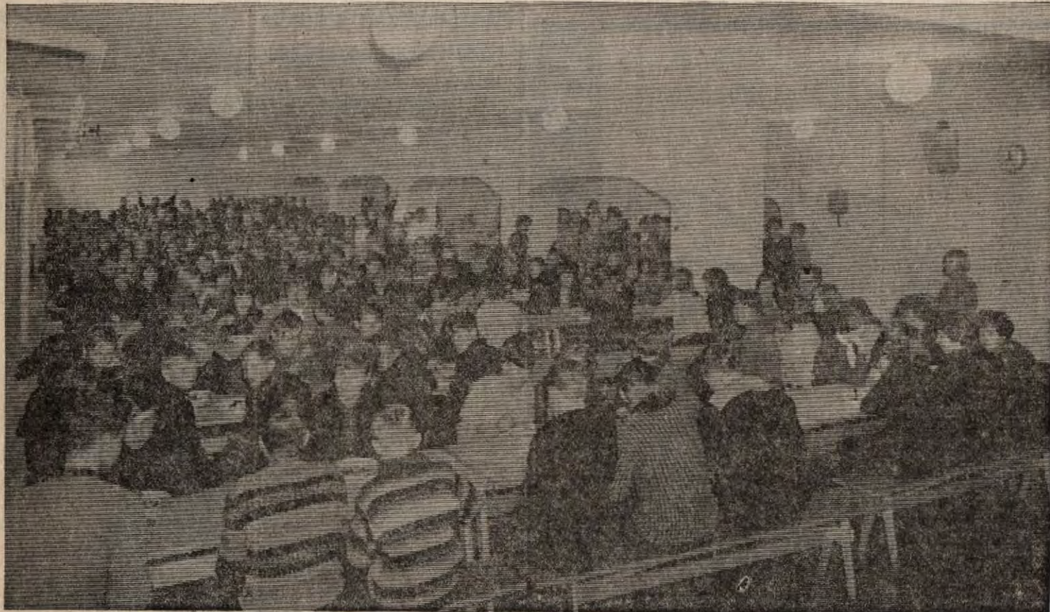
Yli viisisataa tyttöä ja poikaa mahtuu kerrallaan ruokailemaan Porin suomalaisen yhteislyseon ruokasaliin. Koulu on ratkaissut oman keittiönsä avulla ruokailun järjestämisen erinomaisella tavalla. Lämmin ateria maksaa oppilaille vain 35 penniä ja tällä rahalla saa syödä niin paljon kuin ikinä jaksaa.